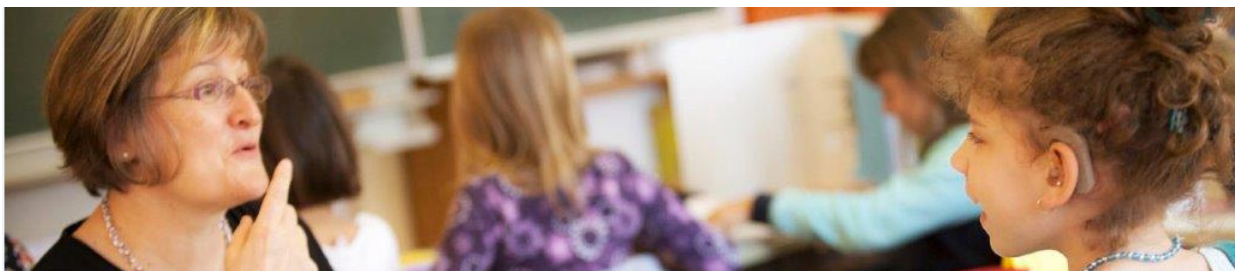
Abbildung 1: Schülerin mit ihrer EKD

Um gesicherte und zukunftsorientierte Anträge für den Einsatz von EKD, Kodier-Dolmetscherinnen bzw. Kodier-Dolmetschern mit ELS, an die Sonderschulinspektorin bzw. den Sonderschulinspektor stellen